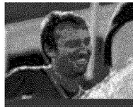
Cuore rossoblù Cesare Cremonini, cantautore, è un noto tifoso del Bologna