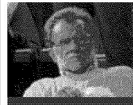
La cultura Il rettore dell'Università di Bologna Ivano Dionigi in tribuna platino